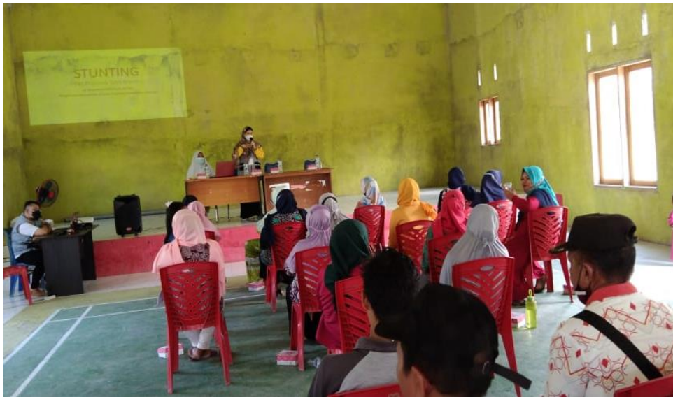
Gambar 1. Dokumentasi Kegiatan Penyuluhan Penggunaan Makeup dan Skincare

Kegiatan penyuluhan ini mengenai edukasi penggunaan kosmetik yang baik dan benar untuk menghasilkan peningkatan pengetahuan tentang apa itu kosmetik, bagaimana cara memilih kosmetik yang baik yang tidak menimbulkan kerusakan kulit pada pengguna menjadi daya tarik bagi masyarakat dalam penggunaan kosmetik yang aman. Kegiatan ini merupakan salah satu bentuk untuk meningkatkan pengetahuan masyarakat mengenai bahaya kosmetik dengan bahan-bahan kimia tertentu serta penggunaannya. Penyuluhan maupun edukasi ini diharapkan dapat membantu masyarakat setempat dalam memberikan pengetahuan tentang dampak yang akan ditimbulkan akibat dari penggunaan kosmetik make up dan skincare yang salah sehingga mereka mampu menyadari dan memilih kosmetik yang sudah terstandarisasi oleh BPOM untuk digunakan pada kehidupan sehari-hari.